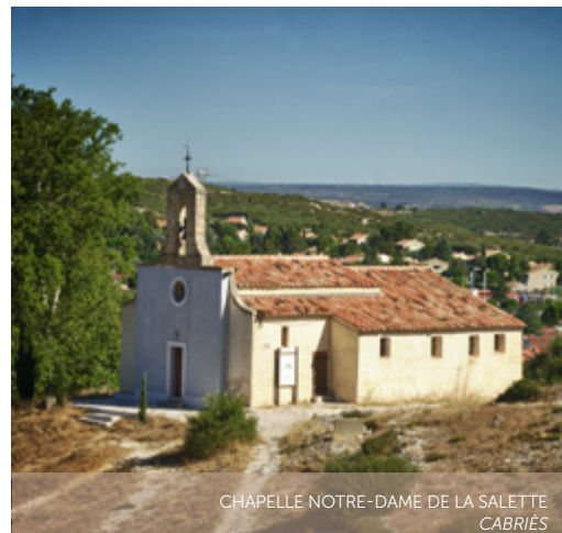
CHAPELLE NOTRE-DAME DE LA SALETTE CABRIÈS