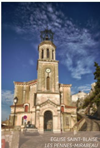
ÉGLISE SAINT-BLAISE LES PENNES-MIRABEAU