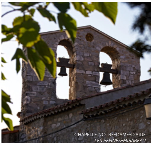
CHAPELLE NOTRE-DAME-D'AIDE LES PENNES-MIRABEAU