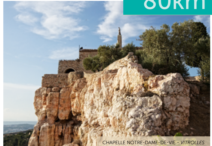
CHAPELLE NOTRE-DAME-DE-VIE - VITROLLES