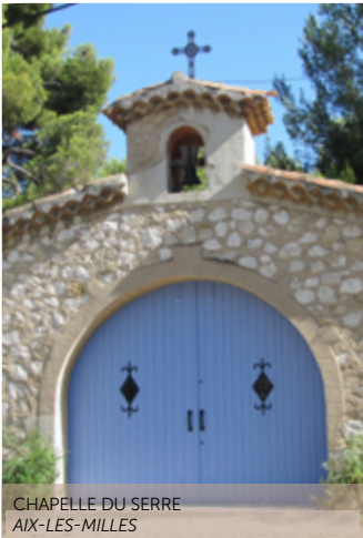
CHAPELLE DU SERRE AIX-LES-MILLES