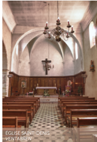
ÉGLISE SAINT-DENIS VENTABREN