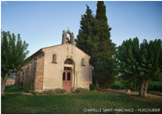
CHAPELLE SAINT-PANCRACE - PUYLOBIER