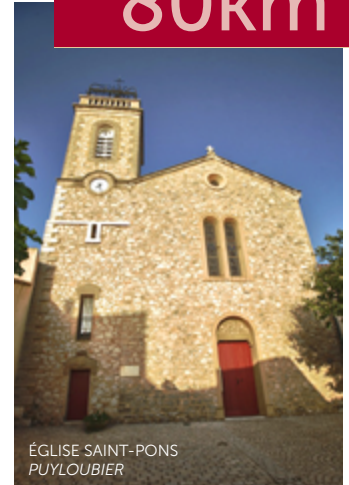
ÉGLISE SAINT-PONS PUYLOBIER