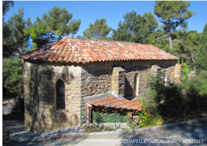
CHAPELLE DU CALVAIRE - ROUSSET