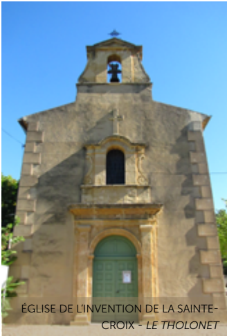
ÉGLISE DE L'INVENTION DE LA SAINTE-CROIX - LE THOLONET