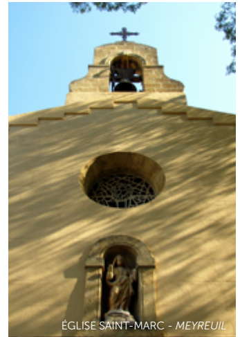
ÉGLISE SAINT-MARC - MEYREUIL