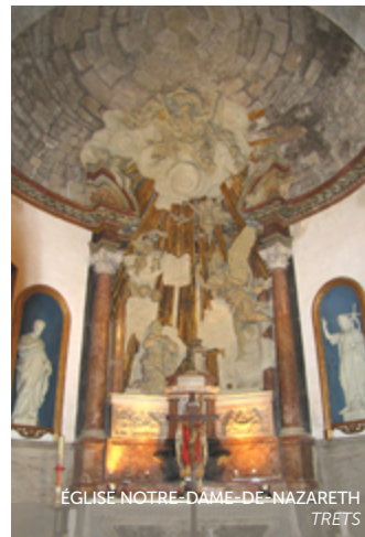
ÉGLISE NOTRE-DAME-DE-NAZARETH TRET